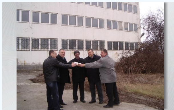
Сградата на РАПИВ-ВТБИ преди нейното обновяване. "Първа копка" 07.01.2005г.