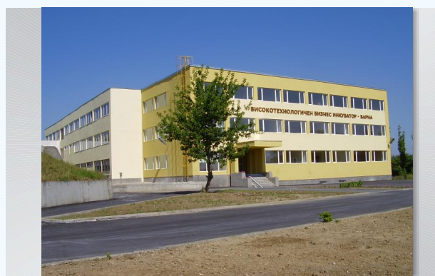
Обновената сграда на РАПИВ - ВТБИ открита на 21.06.2005г.